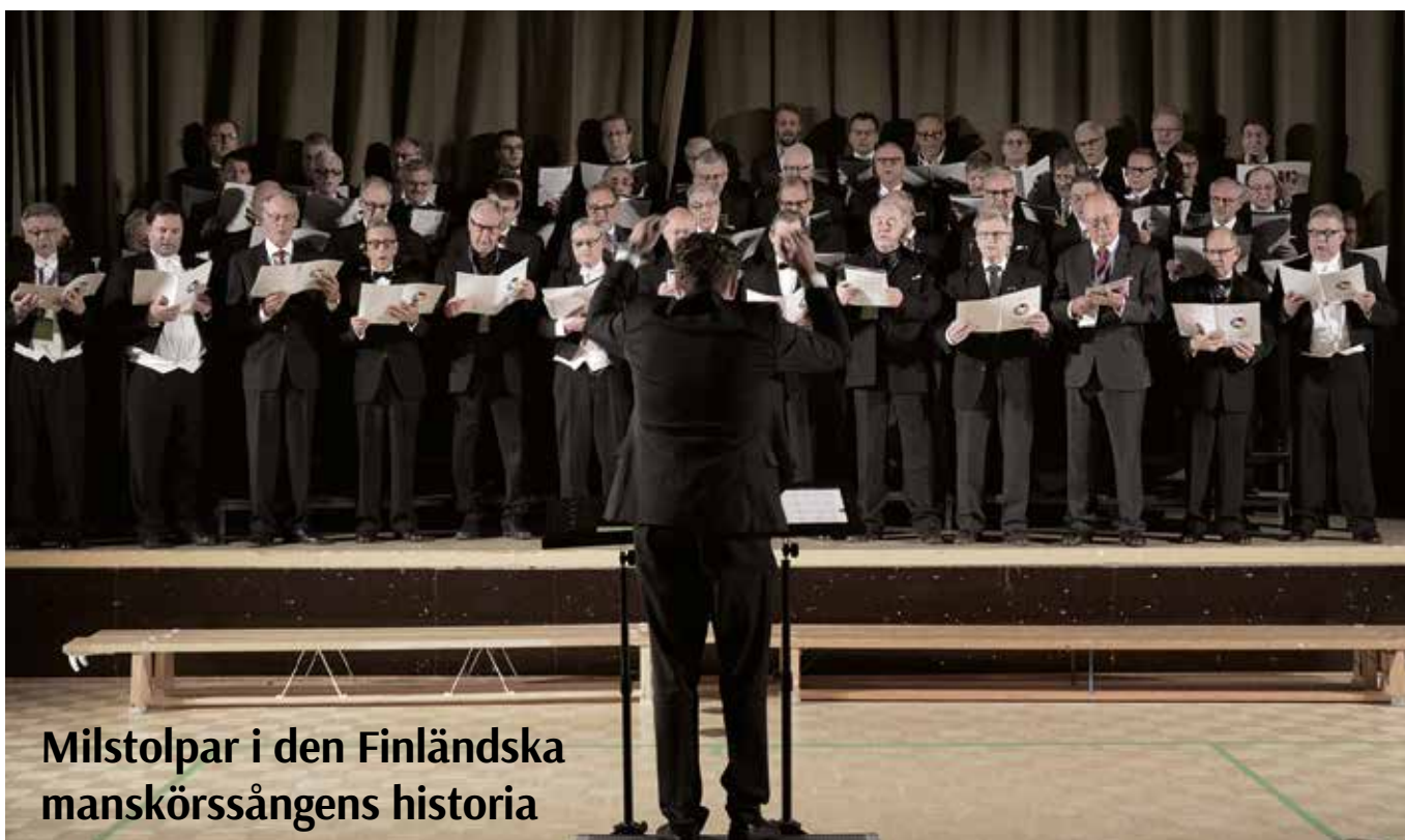
Milstolpar i den Finländska manskörssångens historia