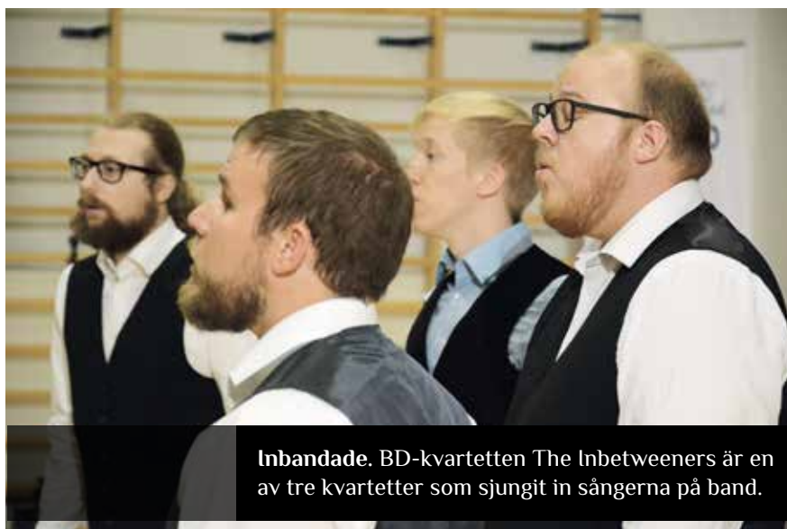
Inbandade. BD-kvartetten The Inbetweeners är en av tre kvartetter som sjungit in sångerna på band.

anvisningar har, när detta läses, distribuerats till körerna och vidare till alla sångare. Övningsfilerna och motsvarande anvisningar finns också samlade på hemsidans Mästarsångarsida.