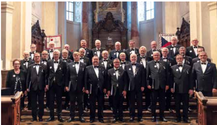
Uppställda. Ekenäs Manskör samlad strax före sin sångavdelning i St. Nicholas Church invid torget i Gamla stan.

Fredagskvällen ägnade sig kören åt kryssning på Vltava-floden med middag och sitssånger. Lördagskvällen var vikt för middag på restaurang med folkmusik och -dans. Några sitssånger rymdes in mellan de proffsiga musikernas nummer. Tydligt klingade