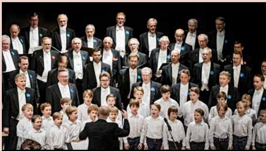
Örnarna uppträder med MM på Finlands 100-årskonsert. Pojkarna fick ljudliga applåder för sin insats.

FSM: styrelse har beslutat att starta en kampanj, för att öka in- tresset för körsång i skolorna, samt på ett positivt sätt informera om sångens möjligheter till positiva